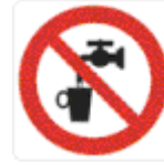
acqua non potabile