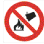
divieto di spegnere con acqua