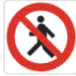
vietato ai pedoni