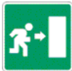
direzione uscita d'emergenza