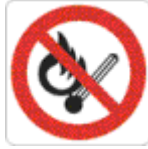
vietato usare fiamme libere