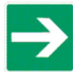
freccia di direzione